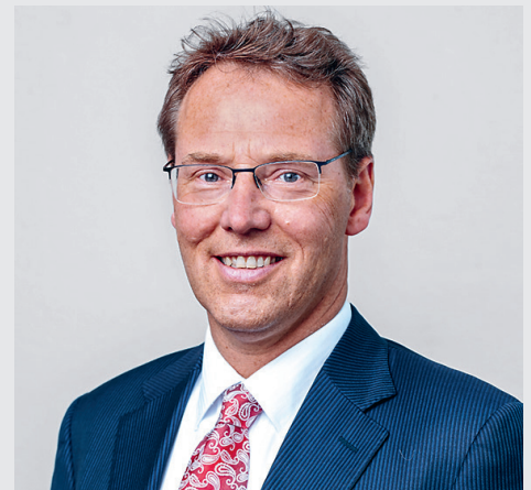
Taco de Vries, CEO Randstad Schweiz AG